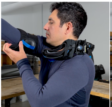
1. Führen Sie die Armmanchetten mit dem blauen Zugband über Ihren Bizeps.