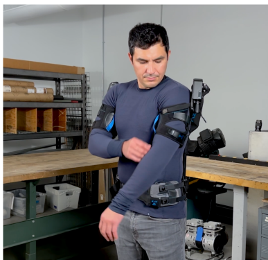
1. Legen Sie Ihren Arm vollständig an der Körperseite an.