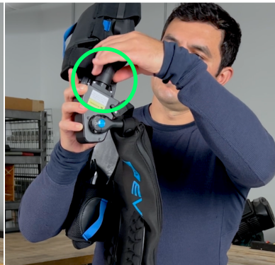
3. Schrauben Sie die Gasdruckfeder in den Federantrieb ein.