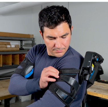
2. Ziehen Sie die drei Riemen an jedem Arm fest, damit sie eng, jedoch bequem anliegen.