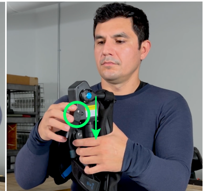
4. Senken Sie den Ekso EVO Arm ab und stellen Sie den Federantrieb auf "AUS".