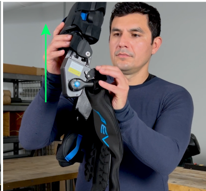
2. Heben Sie den Ekso EVO Arm an.