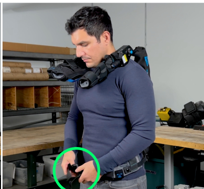
2. Schließen Sie den Hüftgurt und ziehen Sie ihn an den Gurtbändern fest zu.