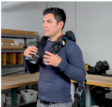
1. Legen Sie die Arme der Ekso EVO über Ihre Schultern.