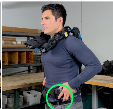
3. Zentrieren Sie die Hüftpolster auf Ihren Beckenknochen.