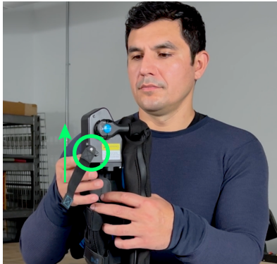
1. Schalten Sie den Federantrieb auf "EIN".