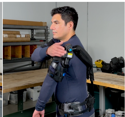
2. Schalten Sie den Federantrieb auf "EIN".