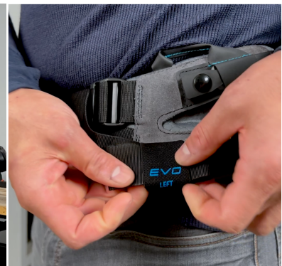
4. Klemmen Sie überschüssiges Gurtband in dem elastischen Band am Hüftgurt ein.